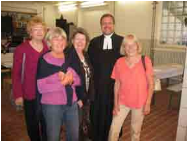
Ein Foto vom Feuerwehrgottesdienst